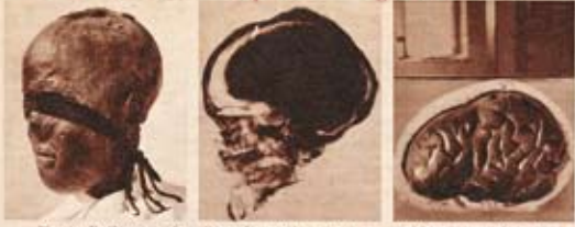
Wie eine Flucht erlöste der erst gefundene Kopf des Mädchens, denn von seinem Gang zum Tode die Haare abstrichelt werden. Unvollständig, erweist sich, wie durch die durchgehenden Augenlider, die Mädchen die Flucht erlöste. Das Gehirn - 2000 Jahre alt - ist als wissenschaftliche Sammler. Das Gehirn wird zur Zeit im Museum in Graz untergebracht.

Der Stern, 14. April 1953, 6. Jg., Nr. 1953.