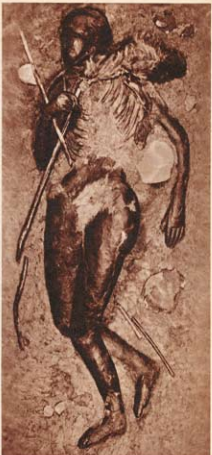
Mord, mit mit einem kleinen Felsstein um die Schultern, wurde sie hingestrichelt. Anthropologische Untersuchungen haben ergeben, daß das 1,24 m große Mädchen mit den voll entwickelten weiblichen Formen erst 14 Jahre alt war. Das Moor hat den Körper vollkommen konserviert. Kaum eine der bisher in Nordwestschland, Dänemark und Holland gefundenen Moorleichen ist so gut erhalten wie das Mädchen von Windeby. Einige Meter entfernt von der Toten fand man Opferringe, die die alten Germanen selbst den Verurteilten nicht vorgesparten.