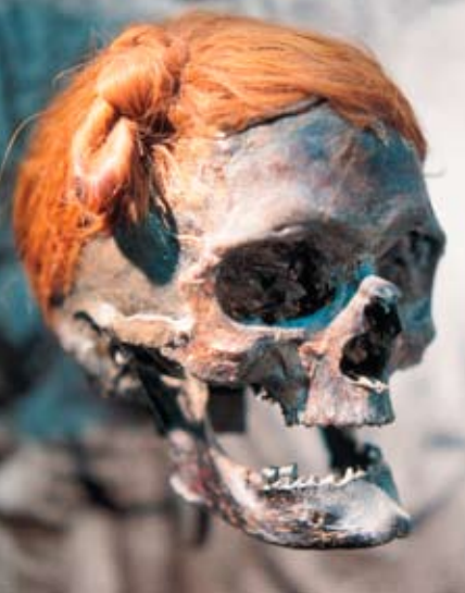
MANN VON OSTERBY Auch in diesem Fall wurde gemogelt: Der Unterkiefer gehört nicht zum Rest des Schädels.

Für den Strick, mit dem das Kind erdrosselt worden sein soll, fand sich kein Nachweis, die Halswirbel sind erst nach dem Tod verdrückt worden. Und auch im Bereich der Rippen findet sich keine Spur von Gewaltanwendung. »Eine sorgfältige Befunderhebung und -dokumentation durch Schlabow hat nicht stattgefunden«, so die beiden Wissenschaftler.