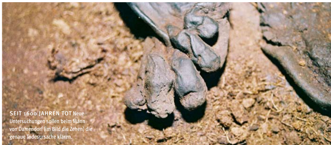
SEIT 1600 JAHREN TOT Neue Untersuchungen sollen beim Mann von Damendorf (im Bild die Zehen) die genaue Todesursache klären.