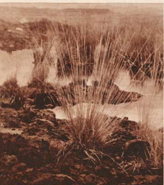
An dieser Stelle starben vor 2000 Jahren die beiden Menschen im Moor von Windeby bei Schleswig des schauerlichen Moortod. Sie wurden im Moor getrieben, angesprochen aus der Gemeinschaft, gegen deren Gesetze sie gründlich hatten. Mord, geknebelt, mit einer Binde um die Augen, einer Schlinge um den Hals, wurden sie verurteilt in den Schlingen des dunklen glibberigen Moores. Unter düsteren Himmelsstrahlen wurden sie hinweggeführt - ein Tod - die Körper ließen, wie sie, nicht erschaffen. Baumstämme wurden über die mit dem Tode Ringenden geworfen... Nach 2000 Jahren wackelt der Moorbagger sie aus ihrem Todesloch!