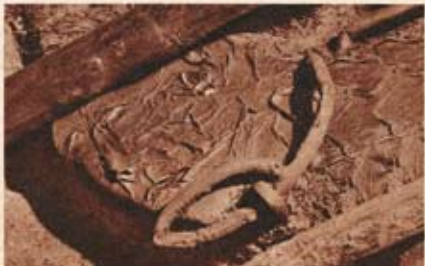
Fluch wie Papier sind Körper und Kopf des zu gleicher Zeit mitlingerischen Mannes. Die Moorleiche hat die Knochen aufgefressen; die spärlichen Haargrüben, die hier zwischen, zeigen den Kalk aus dem Körper. Nach sieht man die Schlinge um den Hals. Im Fluch gebildeten Pergament der Kopfhaut erkannte man nach die Nase (links), darunter - nicht über der Schlinge - den Zug des Mundes, rechts oben, hellbraunlich durch das Baumstamm, mit dem der Körper abgedrückt wurde, das Ohr des etwa dreißigjährigen Mannes.

DIE MÄR NIMMT IHREN LAUF Wissenschaftler brachten die Geschichte in Umlauf, die Öffentlichkeit nahm das Drama dankbar auf (»Stern«, 1953).